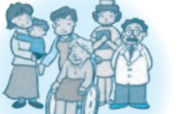
地域密着型介護サービス 「通い」を中心に「訪問」「泊り」を組み合わせて受けられるサービス。