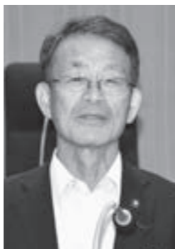
宇野 邦弘 議員