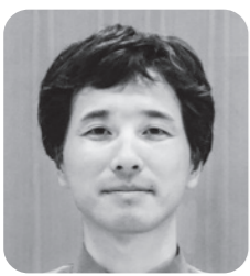
清水 龍司 議員

ケーブルの埋設・保護、フェンスや監視カメラ、センサーライト、見通し確保、点検見回りなど費用対効果を考慮した対策を行う。また、不審者や車両の通報を促し、地域の目による抑止力向上にも取り組む。