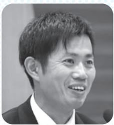
丸石 純一 議員